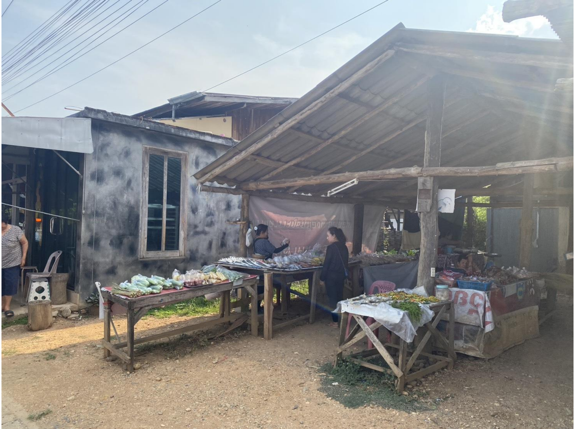
อบต.ออย มีการสำรวจตลาดในพื้นที่ตำบลออย